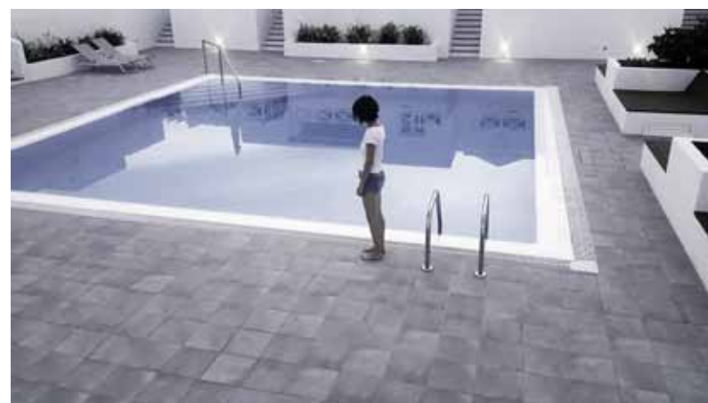
Boi Ima (Come Mommy) Vídeo monocanal, 21 min