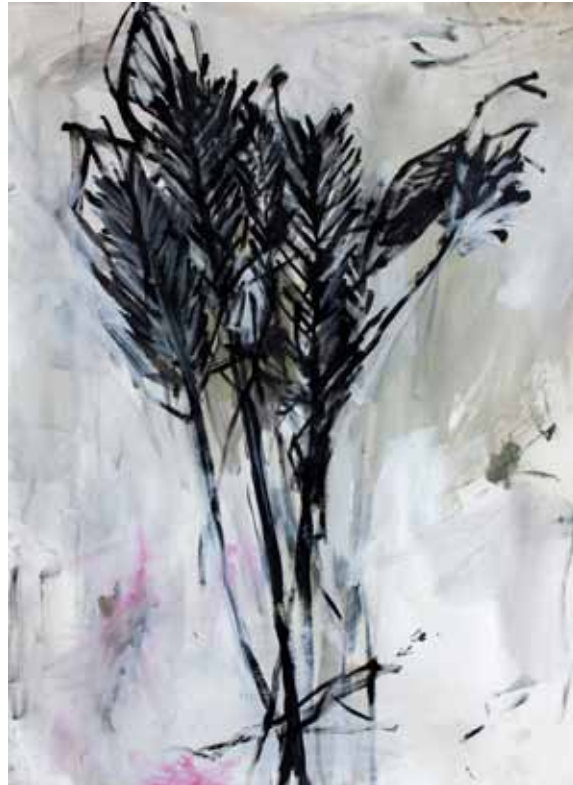
Happy Woman's Day 70x50cm, Acrílico sobre papel 2019