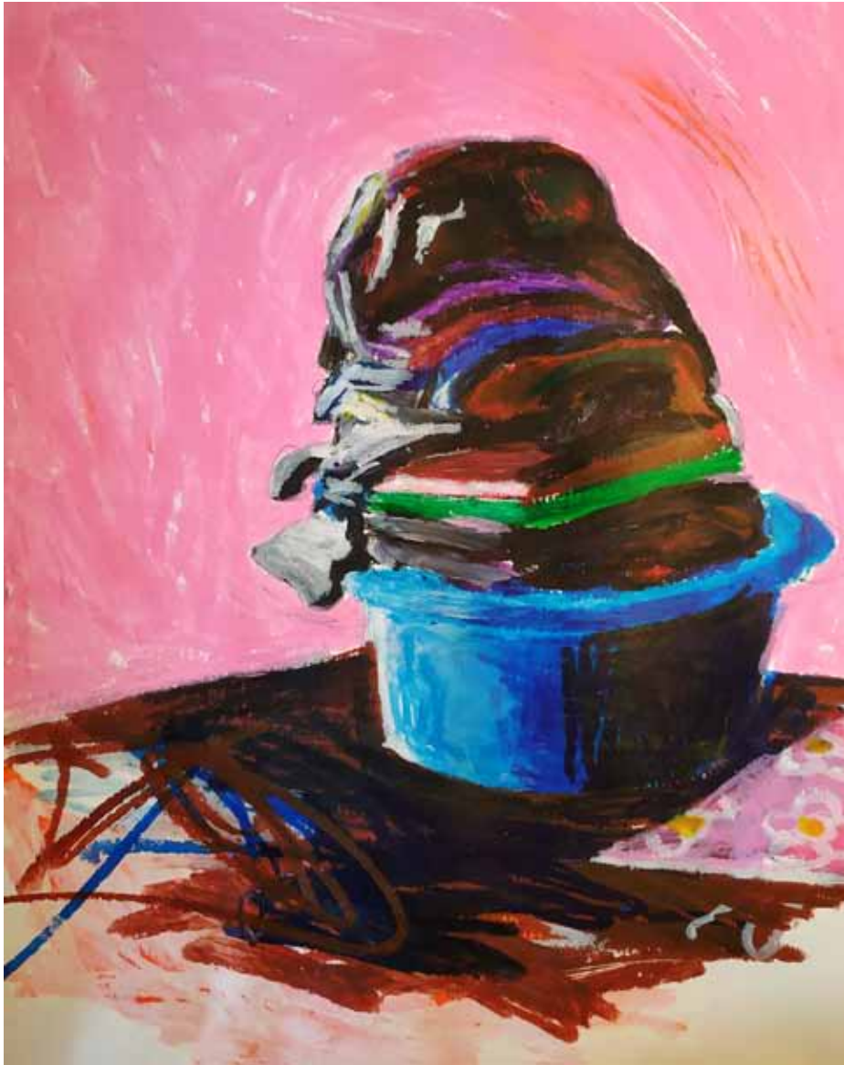
Quarentena - dia 40 42x30 cm, palo gouash sobre papel, 2020