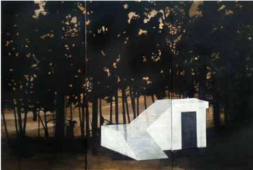
Shelter #03 80x120 cm, tríptico, acrílico sobre tablas de madera, 2017

Los seres humanos somos seres interiores; y al igual que el cuerpo funciona como contenedor del alma, el ser humano necesita de un lugar donde protegerse, cubrirse, al que poder regresar y llamar hogar. En las obras de Aya Eliav encontramos siempre un interés por esta mirada de adentro afuera y viceversa, por la identidad grupal y la identidad personal y las relaciones entre ellas, como por ejemplo vemos también en su serie de pinturas Refugios (“Shelters”). En esta serie, Eliav se inspira en los refugios de guerra de su país natal, Israel, estructuras que, en su infancia, se encontraban en los espacios públicos y que, por un lado, representan lo seguro, lo protegido, pero que, por otro lado, remiten a lo oscuro y misterioso. La artista explora aquí las estructuras que tejen la identidad de un barrio, una ciudad o un país, y en su caso, de su país natal, indagando los límites de esta “doble” cara en el marco de una identidad cultural, su identidad cultural.