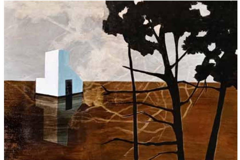
Shelter #10 35x55 cm, técnica mixta sobre tabla de madera, 2021

Eliav también aborda una mirada auto-etnográfica en su video Boi Ima , un video monocanal que representa para ella un contenedor de emociones en el que muestra el lado más visceral, desnudo e íntimo de su vida familiar, su relación con su pareja y su faceta de madre. A partir de herramientas de uso cotidiano como la cámara del móvil o grabaciones por Skype , la artista recoge fragmentos de momentos familiares enlazando de manera subjetiva su mirada íntima en un entorno doméstico con su experiencia humana, social y cultural, explorando la interacción entre el “yo” personal y lo social 2 , como la antropóloga Deborah Reed-Danahay explica en diferentes trabajos sobre este género de etnografía.