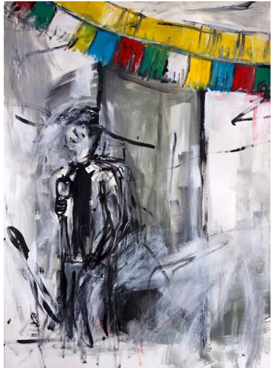
Breaking Up With a Glass of Wine, 70x50 cm, acrílico sobre papel, 2019