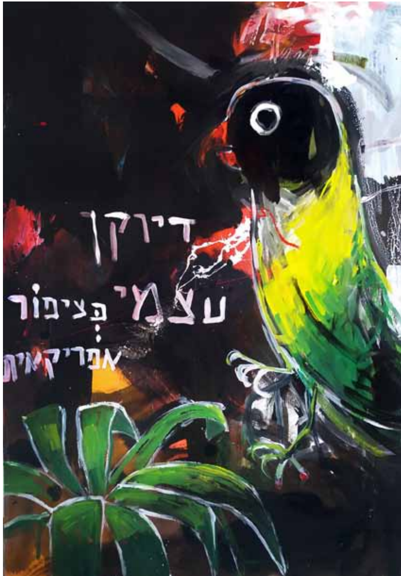
Self Portrait as an African Bird 100x70 cm, técnica mixta sobre lienzo, 2021