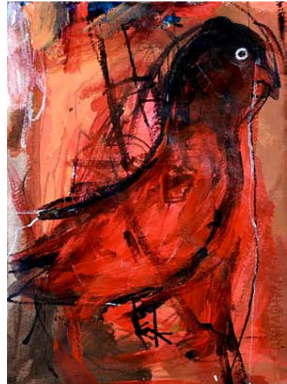
Bad Nina 30x22 cm, Acrílico sobre papel 2020