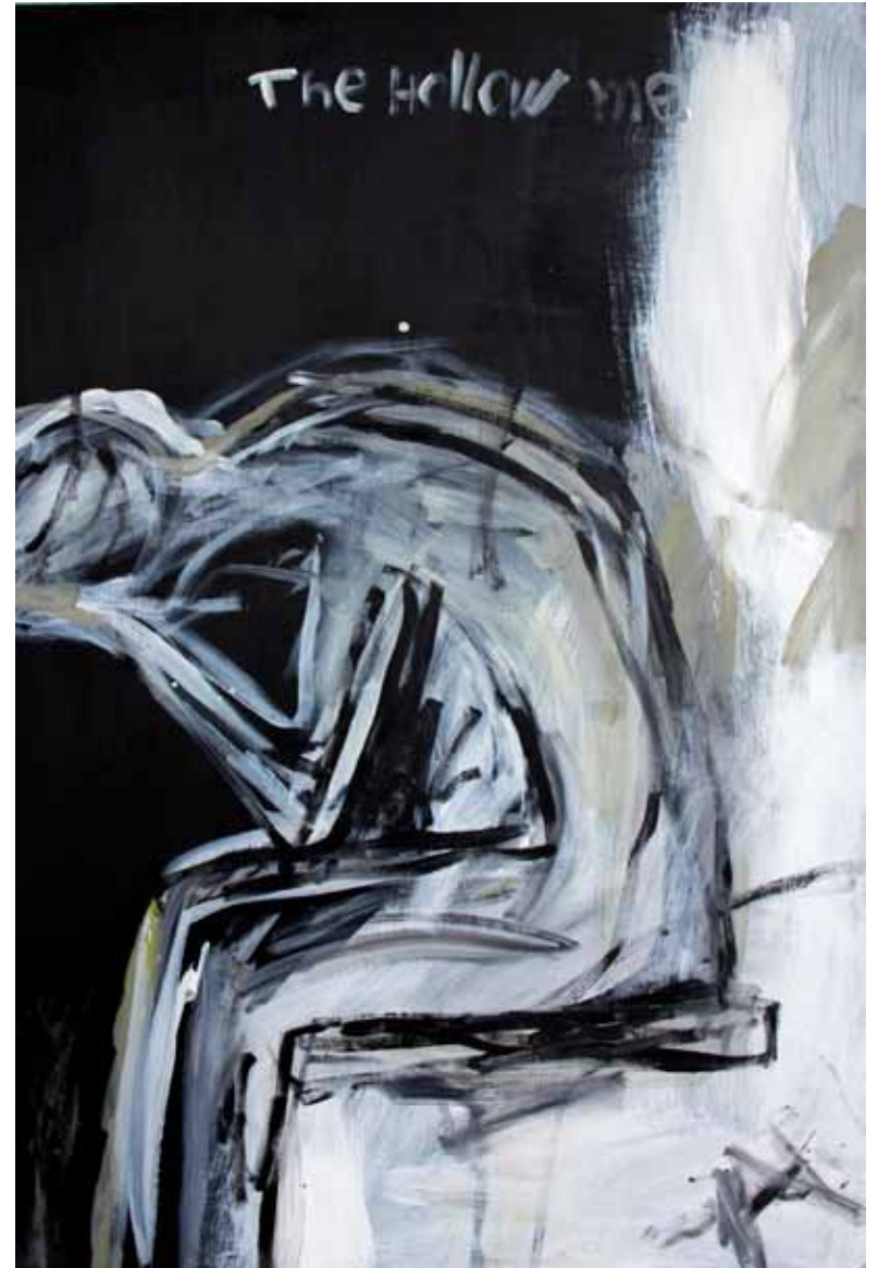
The Hollow Me #02 90x60 cm, acrílico sobre panel de madera, 2019