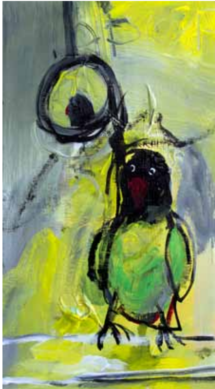
Nina's Portrait with a Mirror 60x20 cm, Acrílico sobre papel 2019